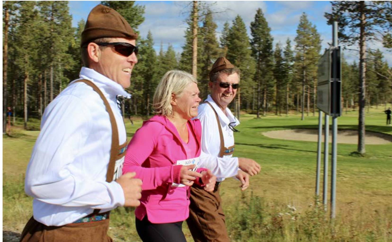
Kokomaratonin reitti kulkee Levitunturin ympäri. Golfkenttä, Ounasjoen ranta ja Immeljärvi ovat matkan varrella.

Lapin syksy on etenkin ulkomaisille matkailijoille tuntematon, vaikka kaikki ainekset sen suosioon ovat olemassa. Puhdas ilma, rauha, värit, revontulet, laadukas majoitus ja monenlaiset aktiviteetit ovat Lapin tunturikeskuksissa olemassa myös silloin. Ne eivät tarvitse lunta ympärilleen. Yksinkertainen idea riittää joskus siihen, että palikat alkavat loksahdella paikoilleen. Ruskamaraton sai alkunsa nuorten miesten yhteisistä juoksulenkeistä. Kun kerran oli hauskaa juosta porukalla, miksei mukaan kutsuttaisi muitakin? Niin tehtiin, ja järjestyksessään 34:s Ruskamaraton kokosi tänäkin vuonna Leville tuhatmäärin väkeä. Tapahtuma on matkailukeskukselle perinteinen piristysruiske kesän jälkeen ja myös hyvä harjoitus talveen.