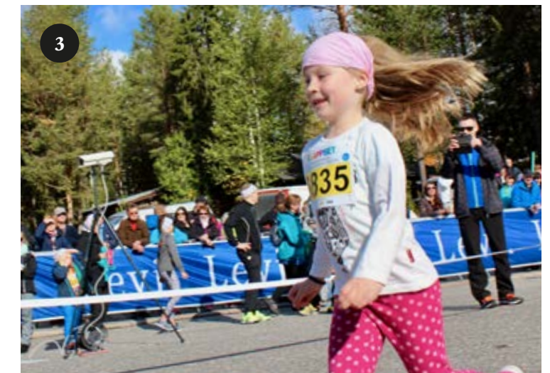
1 Ruskamaraton on kaikenikäisten kisa. Neljävuotiaat juoksivat 200 metriä ja saivat palkinnoksi mitalin ja pillimehun.