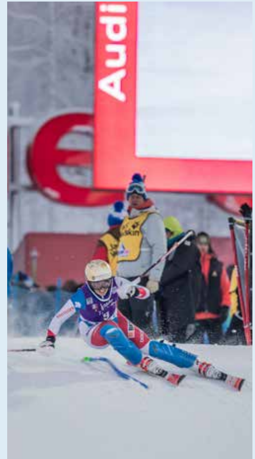
Nykymuotoisen Levin maailmancupin 10-vuotisjuhlat houkuttelivat noin 15 000 ihmistä Leville viikonlopun aikana.