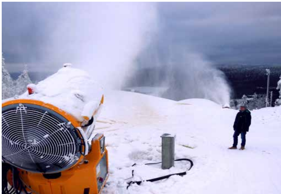
Lumetukseen Levillä on käytössä yli 300 lumitykkiä. Maailmancupin rinteeseen onnistuneen lumituksen takasi 40 lumitykkiä.

- Talvi avataan kuukausi liian aikaisin ja keväällä se kaikkein ihanin kuukausi jää hyödyntämättä. Jos saataisiin tällainen yhteinen, maailmanlaajuinen päätös, että siirretään talvea kuukausi eri paikkaan, niin